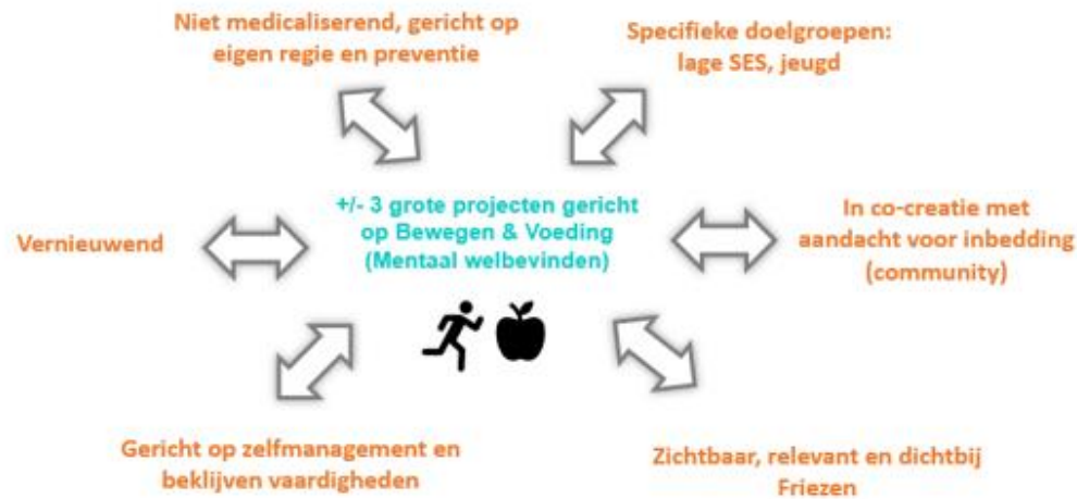
Focus 2019/2020 bewegen & voeding

Verder is voor potentiële aanvragers informatie over Stichting De Friesland te vinden op de website www.stichtingdefriesland.nl