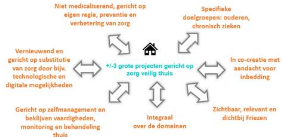
Focus 2021/2023 zorg veilig thuis